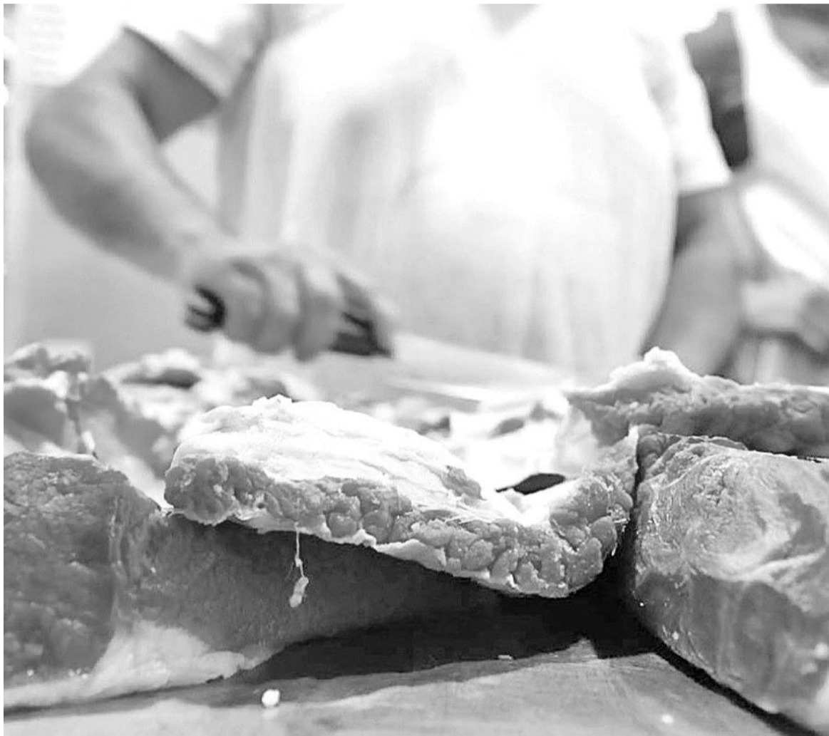
La carne, en su peor momento.

El dato marca el nivel más bajo de consumo en los últimos veinte años y consolida una tendencia a la baja que se sostiene desde el pico de 69,4 kilos registrado en 2008. Esta caída responde a diversos factores económicos y productivos, entre ellos