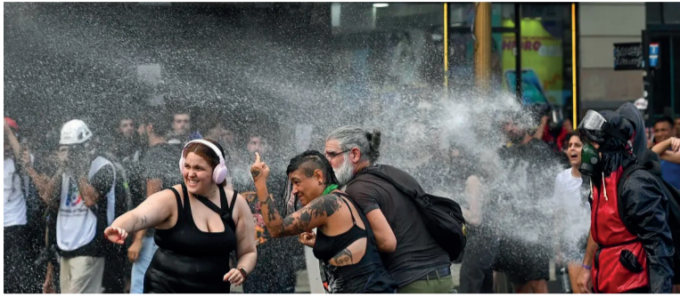
SE REGISTRARON INCIDENTES EN LAS AFUERAS DEL CONGRESO MIENTRAS DIPUTADOS DEBATÍA LA REFORMA LABORAL.

En medio del paro de la CGT, la Cámara baja aprobó la iniciativa de Milei. Modifica salarios, indemnizaciones, vacaciones, horas extra y el derecho a huelga. Elimina la "ultraactividad".