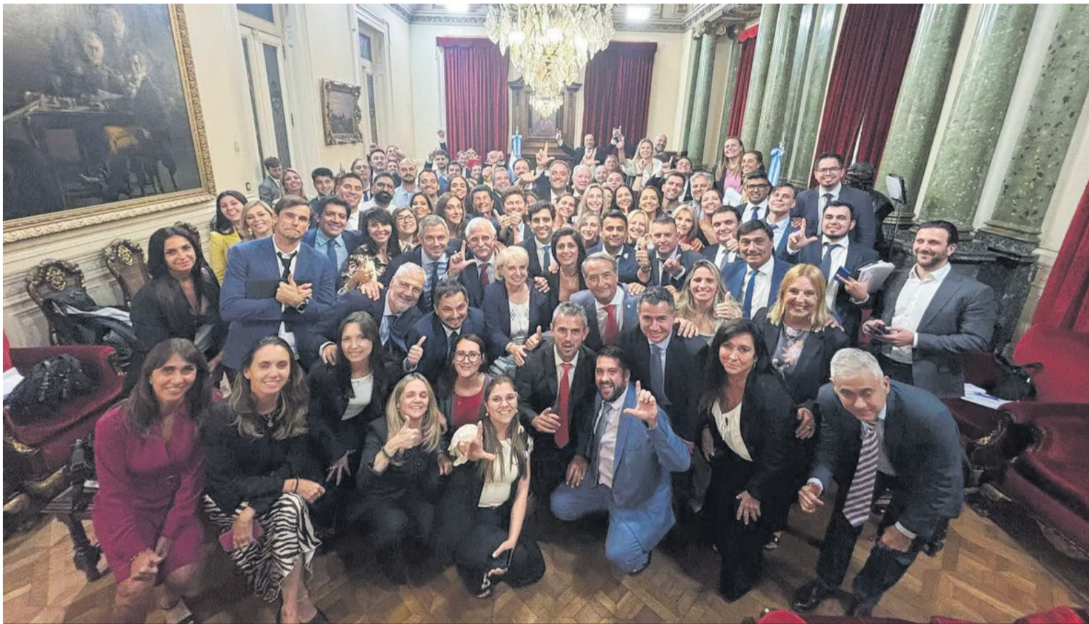
El Gobierno celebró la aprobación de la reforma laboral en medio del paro convocado por la CGT.

Tras la aprobación de la Cámara baja y el dictamen favorable obtenido en un trámite exprés en el Senado, la iniciativa se encamina a convertirse en ley el viernes 27. Introduce cambios en los convenios colectivos y en la Ley de Asociaciones Sindicales, limita el derecho de huelga, crea un fondo para financiar despidos, reduce las indemnizaciones, y crea un banco de horas para no pagar horas extras.