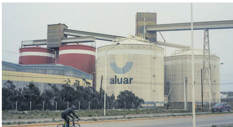
LOS ARANCELES DE TRUMP COMPLICAN A ALUAR QUE DESTINA 40% DE SU PRODUCCIÓN A EE.UU.

La productora de neumáticos que cerró su planta pertenece al grupo Madanes, al igual que Aluar. El anuncio de Fate llegó tras una medida que afectará las operaciones de la metalúrgica.