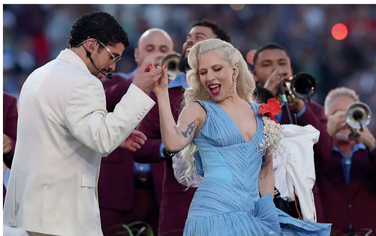
: Lady Gaga durante el espectáculo del entretiempo del Súper Bowl LX.

Para los gobernantes en Washington, el pueblo puertorriqueño era en su mayoría una molestia a gestionar. Pero a pesar de todo esto, los boricuas encontraron formas de prosperar. Crearon su propia música, comida, tradiciones orales y negocios, forjando una cultura ferozmente resiliente y alegre que ahora se ha exportado al mundo. Y Bad Bunny, en solo unos minutos de televisión, comunicó a 160 millones de personas en vivo y directo: la opresión, el ingenio, la alegría de su pueblo. Ochenta años después de que el gobierno prohibiera izar una bandera puertorriqueña o cantar una melodía patriótica, Benito Antonio Martínez Ocasio, ondeó orgulloso la bandera y cantó sus canciones puertorriqueñas, rodeado