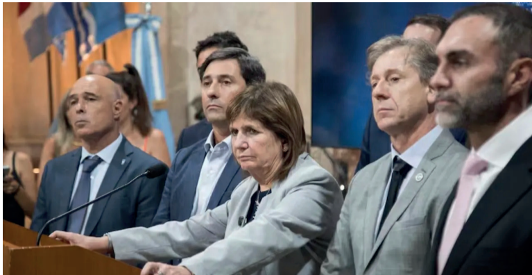
EL GOBIERNO APROBÓ EN EL SENADO EL PROYECTO CON 42 VOTOS A FAVOR Y 30 EN CONTRA.

El Senado aprobó el proyecto de ley de reforma laboral que impulsa el Gobierno. La creación de empleo formal se mantiene estancada desde hace 12 años. Avanzan la informalidad y el monotributo. Los salarios registrados cayeron 22% real desde 2016, según el Indec.