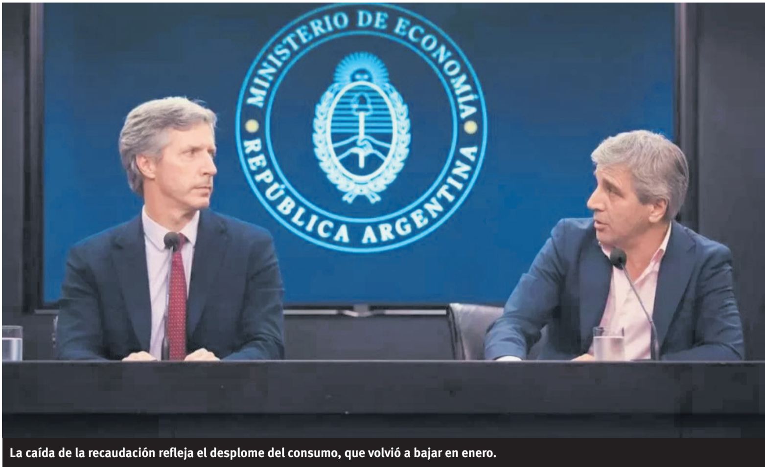
La caída de la recaudación refleja el desplome del consumo, que volvió a bajar en enero.

La regresividad es la principal cualidad del sistema impositivo argentino. Dos terceras partes de la recaudación son gravámenes al consumo, donde el IVA representa el 6,94% del PIB. En cambio, el impuesto a las ganancias es el 4,18% y bienes personales (patrimonio) representa el 0,22% del PIB. El esquema actual alimenta excedentes para comprar dólares y fugarlos.