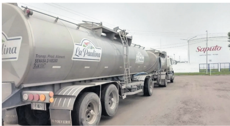
SAPUTO HABÍA DESPLAZADO A MASTELLONE COMO LA PRINCIPAL PROCESADORA DE LECHE DEL PAÍS.

La canadiense Saputo, dueña de La Paulina Ricrem y Molfino, vendió el 80% de su negocio. Había llegado en 2003 al comprar las plantas a Pérez Cómpanc en Santa Fe y Córdoba para convertirse en la mayor procesadora de leche. El ingreso del holding peruano Gloria Foods.