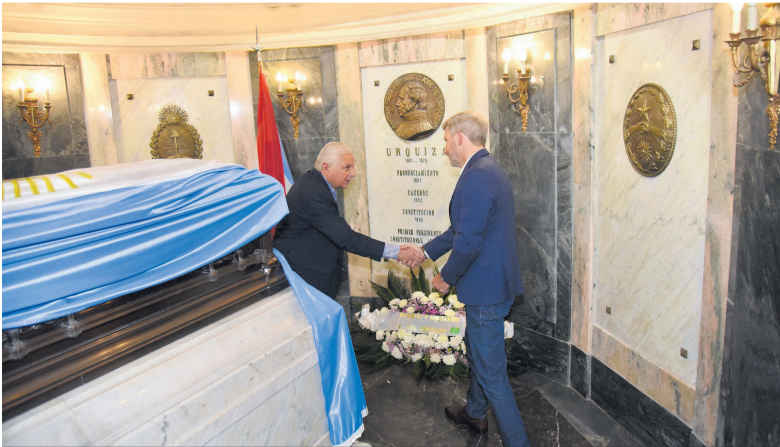
Con referencias constantes a Urquiza, Frigerio habló del puerto local, de la deuda provincial, la industria, la educación y los salarios.

Con motivo del 173 aniversario de la Batalla de Caseros, el mandatario anunció el inicio de las obras de restauración del Palacio San José. Criticó a “los políticos que dejaron caer una joya arquitectónica e histórica”, “financiaron a sus amigos” y “nos dejaron en una crisis sin precedentes”.