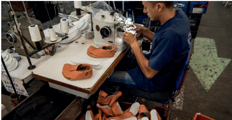
LA NUEVA LEY HABILITARÁ LA AMPLIACIÓN DE LA JORNADA HASTA UN MÁXIMO DE 12 HORAS.

De prosperar el proyecto, las indemnizaciones serán más bajas que las actuales, ya que se excluye del cálculo al aguinaldo, las vacaciones, los premios y otros beneficios que no