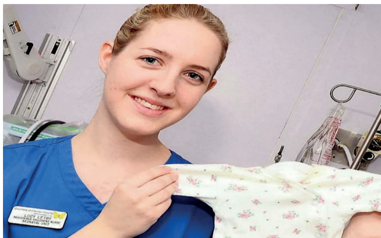
“La investigación de Lucy Letby”.

La enfermera se hizo famosa en el Reino Unido cuando fue acusada y condenada en 2023 por el asesinato de siete bebés y el intento de asesinato de otros seis. Se convirtió en la asesina en serie más prolífica. Pero el documental de Netflix expone el caso como el mayor error judicial.