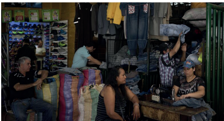
LA IMPORTACIÓN DE ROPA DE USADA, LOS ALQUILERES CAROS Y EL TIPO DE CAMBIO HUNDEN A LA PRODUCCIÓN NACIONAL.

El crecimiento exponencial de importaciones de ropa usada superó el 19.000% interanual. Alcanza 12% del total de las prendas que ingresan. Pero vestirse es costoso. Marcas como Zara venden el mismo producto fabricado en Bangladesh más caro en Argentina que en Europa.