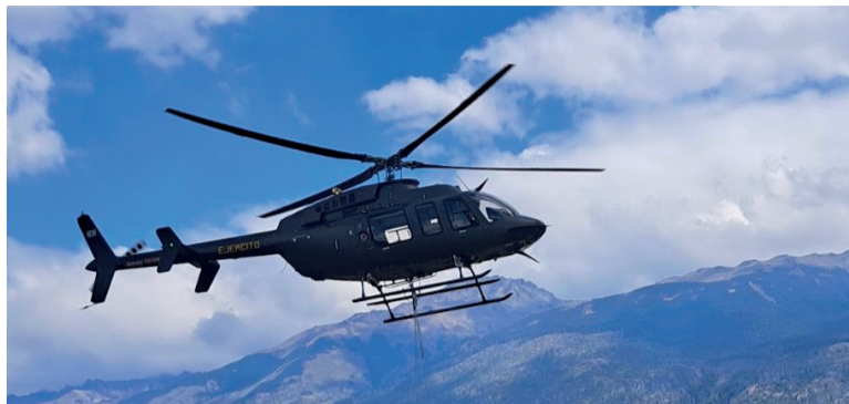
DOS HELICÓPTEROS DE LA SECCIÓN DE AVIACIÓN DE EJÉRCITO OPERAN PARA COMBATIR 168.000 HECTÁREAS INCENDIADAS.

En medio de la presión de los gobernadores, el Ejecutivo nacional declaró la emergencia ígnea en Chubut, Río Negro, Neuquén y La Pampa. Las causas y las culpas por las 168.000 hectáreas arrasadas. El factor climático y el político de un verano plagado de fuegos reales y artificiales.