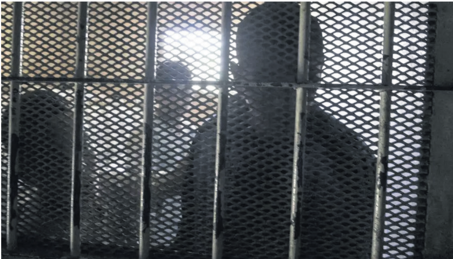
El proyecto que será tratado en sesiones extraordinarias no distingue la infancia de la adultez.

Según la Corte Suprema de Justicia, la mayor cantidad de causas contra menores de 18 años se da en Santa Fe, con 4.551 imputaciones. Aunque la mayoría de los casos del país corresponden a delitos contra la propiedad, en Entre Ríos destacan los delitos contra las personas. En Argentina hay 12.200.000 menores. Sólo el 0,55% está involucrado en alguna denuncia penal.