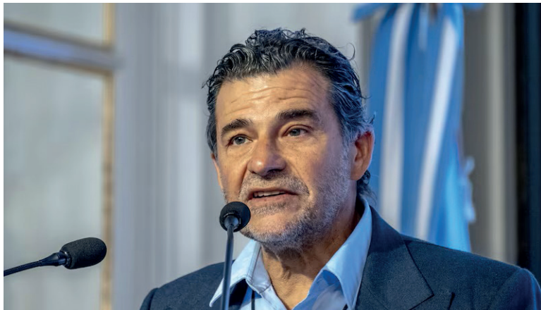
MIGUEL GALUCCIO MARCÓ TRES CISNES NEGROS DE LA GEOPOLÍTICA Y PETRÓLEO.

En el marco de un evento organizado por EconoJournal, Galuccio señaló que el país debe trabajar “costos, desregulación y ser atractivos para inversores”.