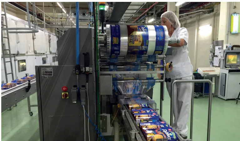
MONDELEZ PRODUCE EN PACHECO, GALLETITAS TERRABUSI, OREO, PEPITOS, TITA Y RHODESIA.

La fábrica tiene una historia extendida en el país, y produce varias de las marcas más reconocidas de galletitas y chocolates. Su ubicación