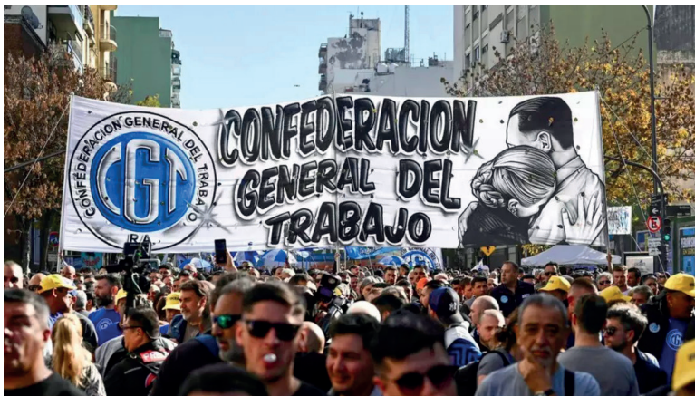
LA CGT SE MOVILIZÓ POR ÚLTIMA VEZ EN EL DÍA DEL TRABAJADOR.

“Este proyecto es un paso más contra los derechos individuales y colectivos de los trabajadores”, anunció Sola, uno de los secretarios de la CGT, tras el encuentro. El dirigente