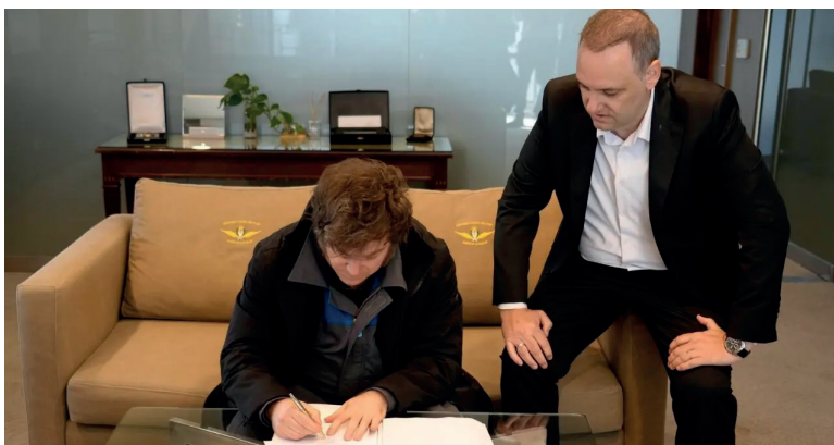
JAVIER MILEI FIRMA EL PROYECTO DE REFORMA DE LEY LABORAL QUE ENVÍO AL CONGRESO.

Las indemnizaciones serán más bajas que las actuales, ya que se excluye del cálculo al aguinaldo, las vacaciones, los premios y otros beneficios que no sean de pago mensual.