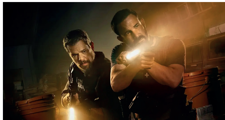
Damon y Affleck interpretan en “La racha” a dos policías emboscados tras hallar 20 millones de dólares.

Es una época más extraña e impredecible en Hollywood, especialmente con el inminente acuerdo multimillonario que podría cambiar el negocio para siempre: la decisión de Netflix de adquirir Warner Bros. Por ahora, sin embargo, todavía tenemos películas que celebrar, y no faltan historias originales, adaptaciones y remakes que esperar el próximo año.