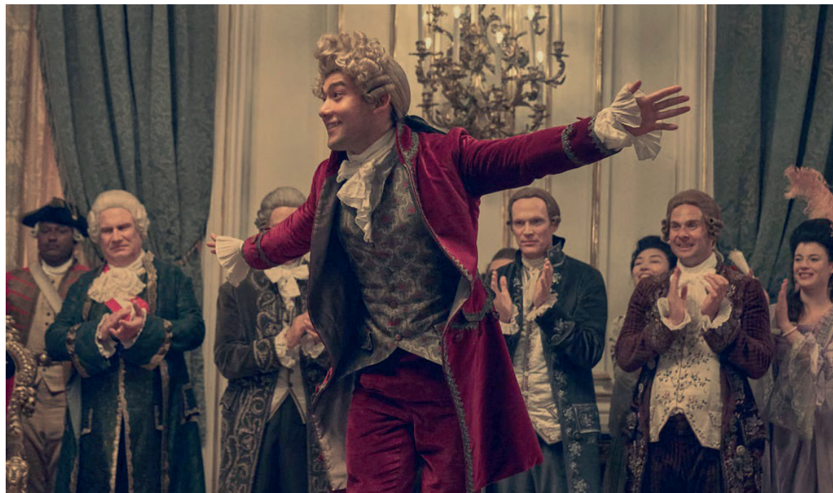
Will Sharpe como Wolfgang “Amadeus” Mozart en la nueva miniserie de Sk

La serie basada en la obra de Peter Saffer de 1979 busca repetir la magia de la película de 1984 y atraer a un público fresco hacia la música clásica. Una sinfonía genial de rivalidad y venganza.