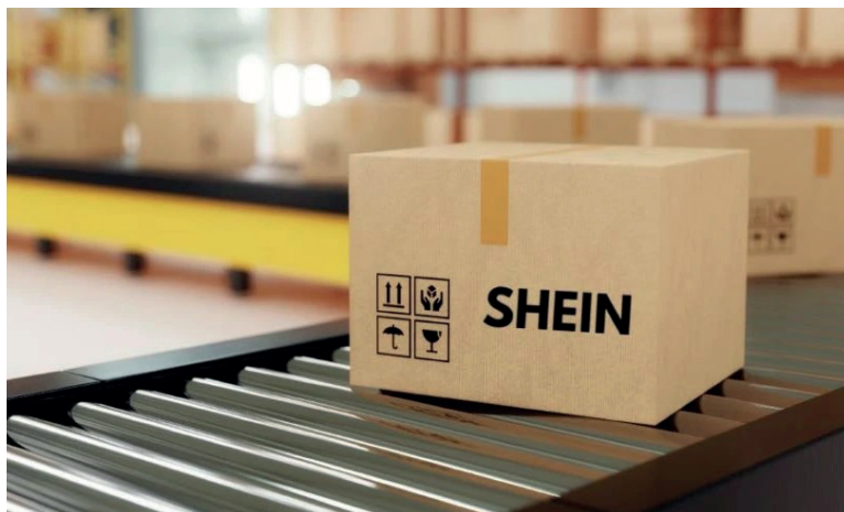
LAS COMPRAS AL EXTERIOR RECONFIGURAN PAUTAS DE CONSUMO Y COTAS DE PRODUCCIÓN.

Los datos muestran un patrón claro. A la vez que los bienes intermedios crecieron 6,2% interanual, las piezas y accesorios para bienes de capital subieron 17,4%. Pero el verdadero salto se dio en otros rubros. Las compras externas de vehículos se incrementaron 109% interanual, los bienes de consumo avanzaron 58,3% y los bienes de capital crecieron 55,6%. La mayor presencia de bienes finales, en particular de con-