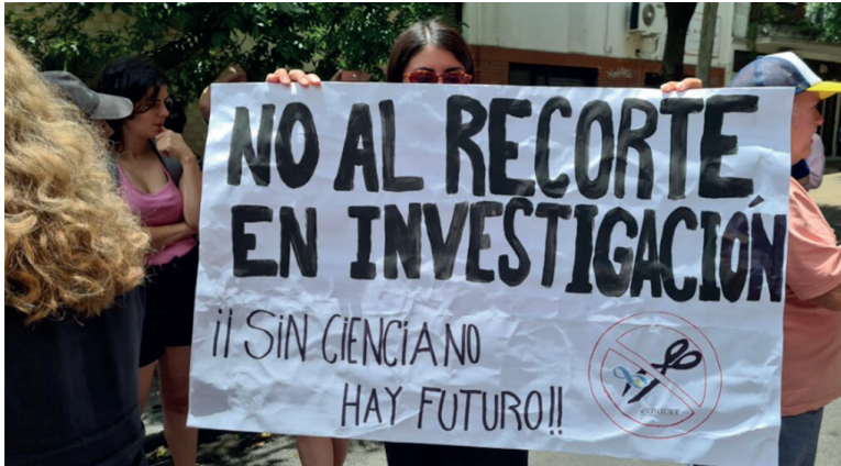
EL CONICET PERDIÓ EL 31% DE SUS FONDOS, EL INTA EL 36% Y EL INTI EL 47%.

El derrumbe del financiamiento público a la ciencia no encuentra un piso, ya está en niveles inferiores a los del 2001. Organismos, científicos, becarios y trabajadores padecen el ajuste.