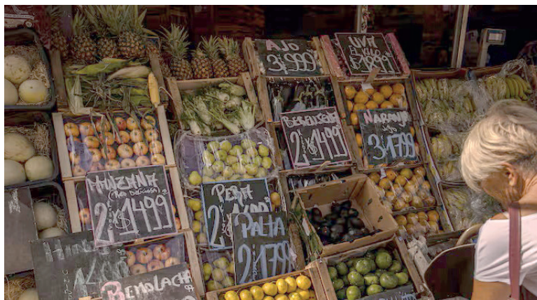
LA ALIMENTACIÓN TIENE MÁS PESO EN EL ÍNDICE DE PRECIOS QUE OTROS RUBROS.

Las consultoras privadas anticipan que la inflación de diciembre en Argentina no diferirá mucho respecto del 2,5% que marcó en noviembre. Así, el IPC cerrará el año