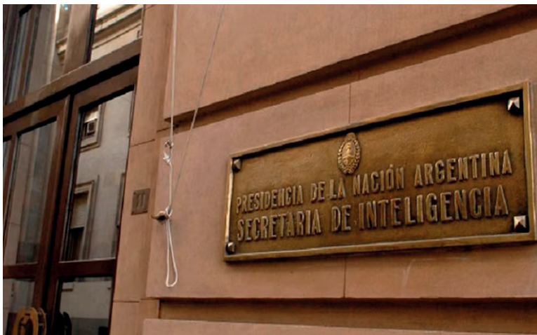
EL DNU ESTABLECE QUE TODAS LAS ACTIVIDADES DE INTELIGENCIA TIENEN CARÁCTER ENCUBIERTO.