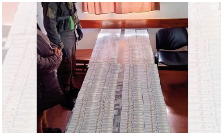
Dinero en efectivo decomisado.