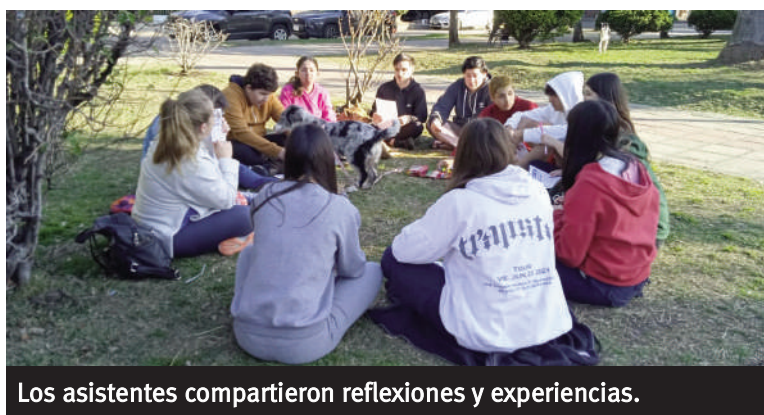
Los asistentes compartieron reflexiones y experiencias.

El Consejo Municipal de Juventud, junto a las direcciones de Salud Mental, y la de Inclusión para Personas con Discapacidad, realizan la Semana de las Juventudes, bajo el lema: ‘Nuestra salud mental importa’. En este marco se llevó adelante el taller de PsicoArte en la plaza San Martín. Allí, los jóvenes que se acercaron al lugar reflexionaron y compartieron experiencias vinculadas a cómo gestionar sus emociones, sentimientos, la salud mental, qué entienden ellos sobre la temática y más, con presentaciones y charlas grupales, a lo largo de una hora y media. La Semana de las Juventudes finali-