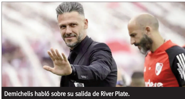
Demichelis habló sobre su salida de River Plate.

El director técnico argentino Martín Demichelis habló por primera vez después de su salida de River Plate. Reveló detalles sobre su paso por la institución de Núñez.