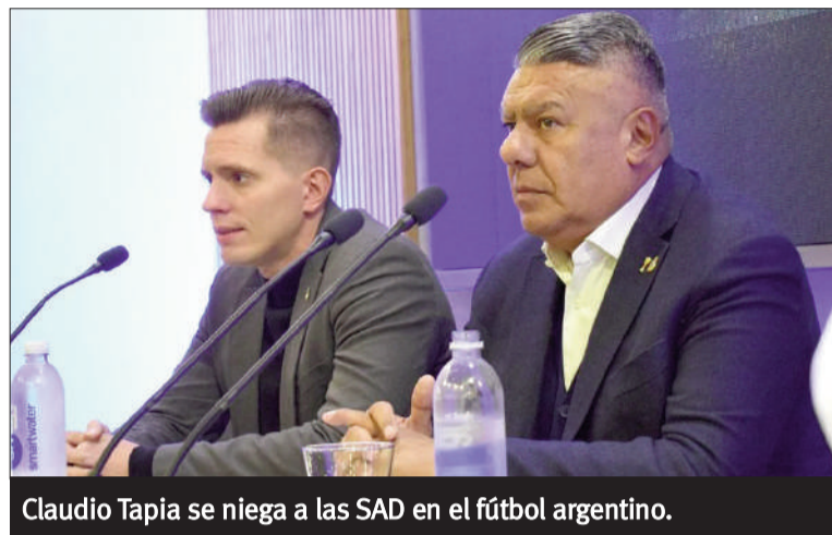
Claudio Tapia se niega a las SAD en el fútbol argentino.

la importancia del fútbol como motor económico y social del país, afirmando que los clubes no solo son espacios deportivos, sino también de contención social.