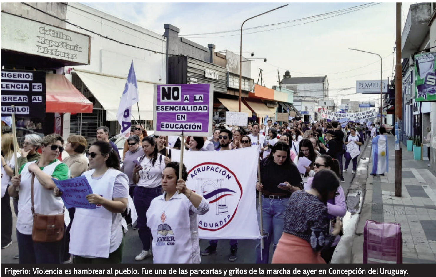
Frigerio: Violencia es hambrear al pueblo. Fue una de las pancartas y gritos de la marcha de ayer en Concepción del Uruguay.

LOS DOCENTES REALIZARON AYER LA MARCHA EN EL SEGUNDO DÍA DE PARO