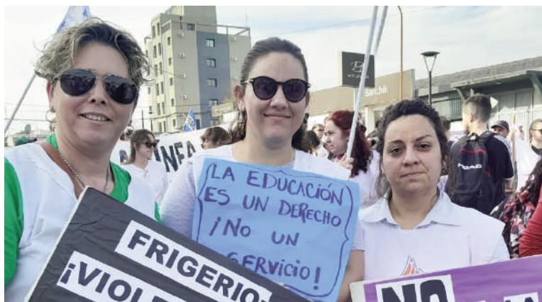
Se convocó a las familias a acompañar esta demanda.

En este marco, se convocó a las familias para que este viernes 16, cuando vayan a retirar a sus hijos e hijas a la salida de cada escuela, acompañen a los maestros con sus