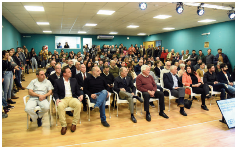
Procuran que los vecinos sean protagonistas de las respuestas.

Con un acto del que participaron autoridades municipales, empresas del sector privado y la sociedad civil, el Municipio presentó oficialmente el Plan Integral de Movilidad Urbana Sostenible (Pimus) en Concepción del Uruguay.