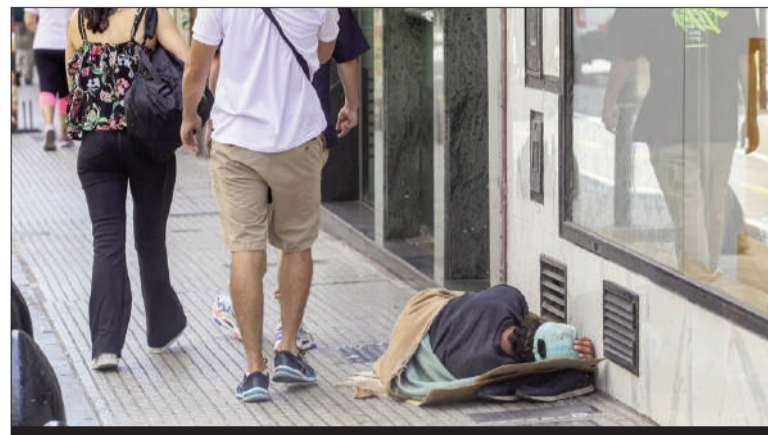
"De retirarse la AUH las cifras serían peores", dice el estudio.

"Esta es la cifra más alta desde el 2010", afirmaron desde la UCA y añadieron que "desde el 2020, las