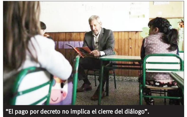
"El pago por decreto no implica el cierre del diálogo".

A pesar del rechazo de los gremios a la última propuesta salarial, el gobernador afirmó: "Seguiremos dialogando con todos los re-